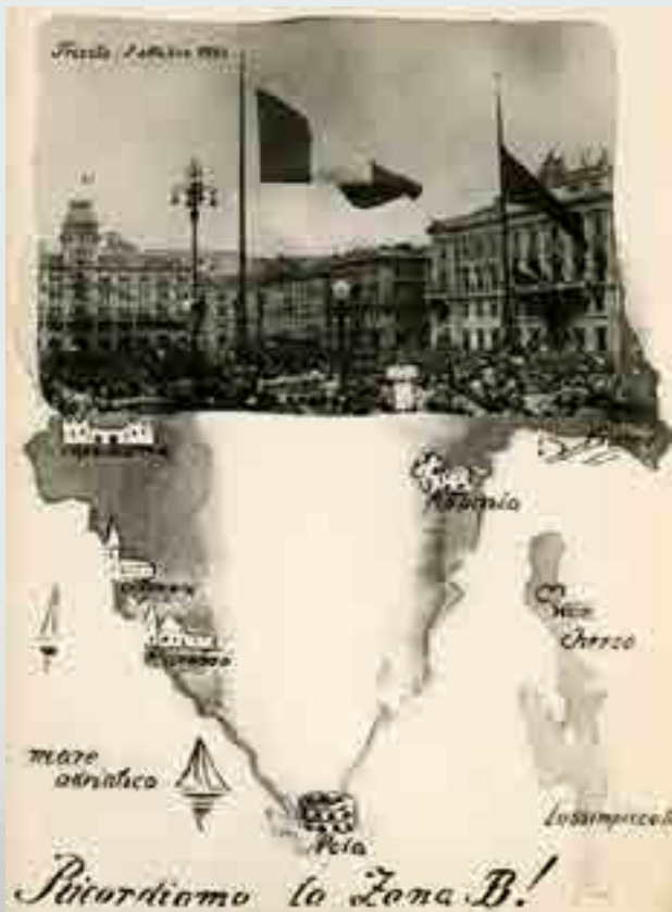
"Ricordiamo la Zona B!", cartolina edita per il ritorno di Trieste all'Italia, 1954