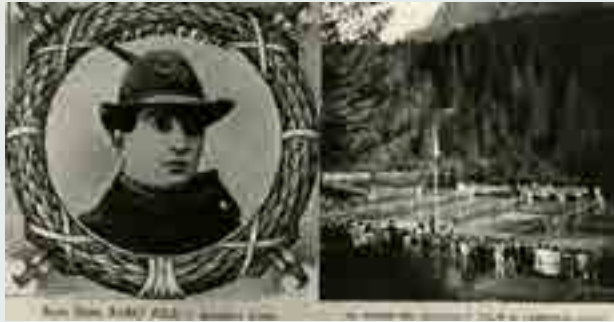
Opera per l'Assistenza ai Profughi Giuliani e Dalmati - Collegio "Fabio Filzi" - Gorizia, cartolina, anni '50