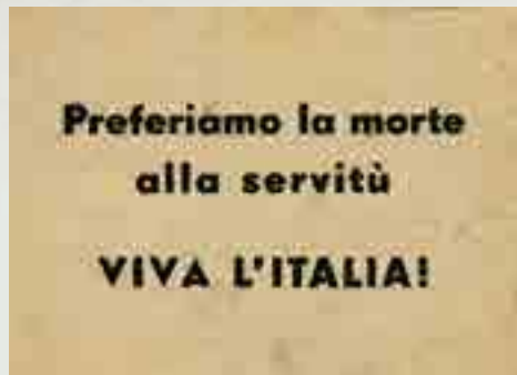
"Preferiamo la morte alla servitù. VIVA L'ITALIA!", volantino, 1946/47