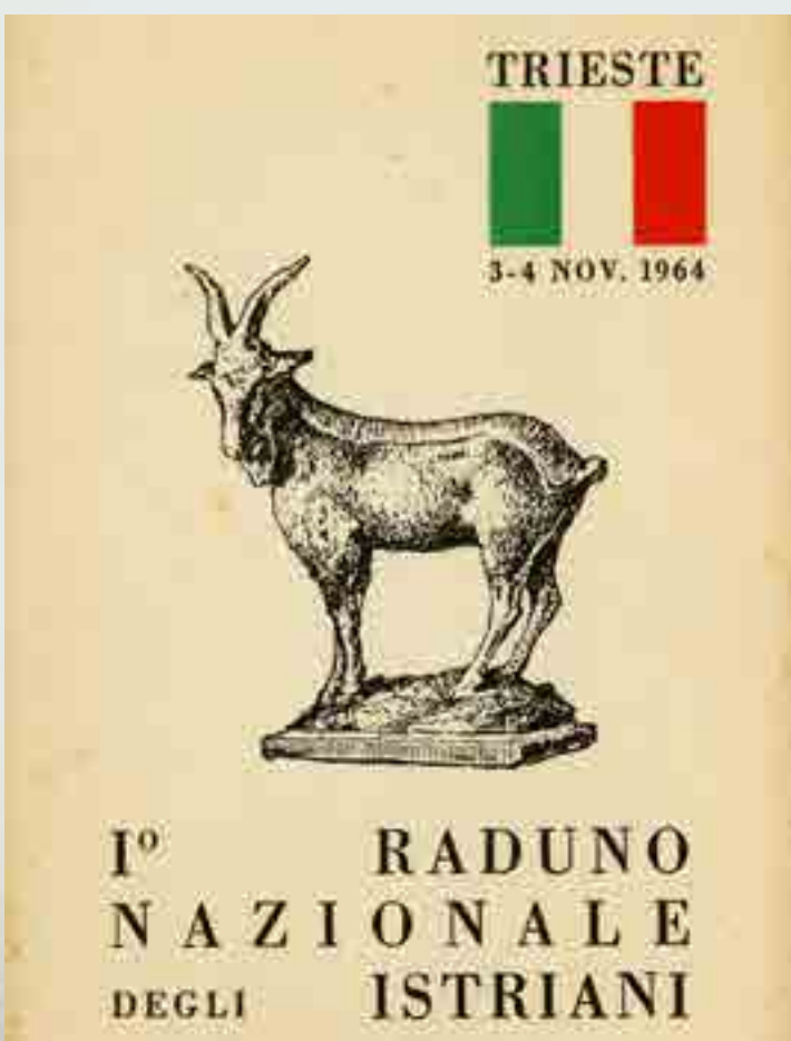
I.° Raduno Nazionale degli Istriani, cartolina, Trieste 3-4 novembre 1964