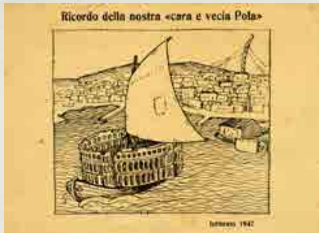
Ricordo della nostra "cara vecchia Pola", febbraio 1947, cartoncino ricordo