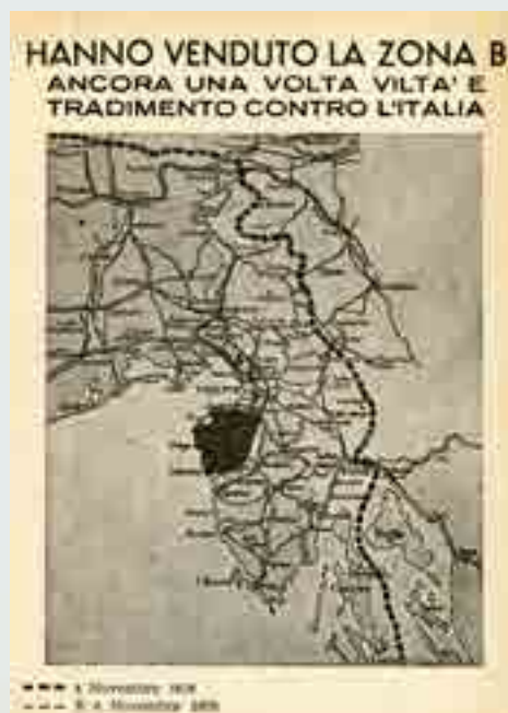
"Hanno venduto la Zona B ...", cartolina a cura dell'Associazione Nazionale Arditi d'Italia, 1975