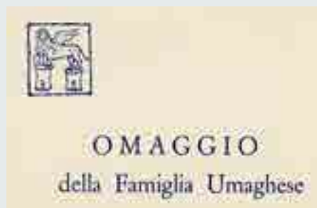
Famiglia Umaghesa, segnalibro in occasione del 50.° di fondazione della Famiglia 1959-2009 e cartoncino per invio omaggio, anni '60