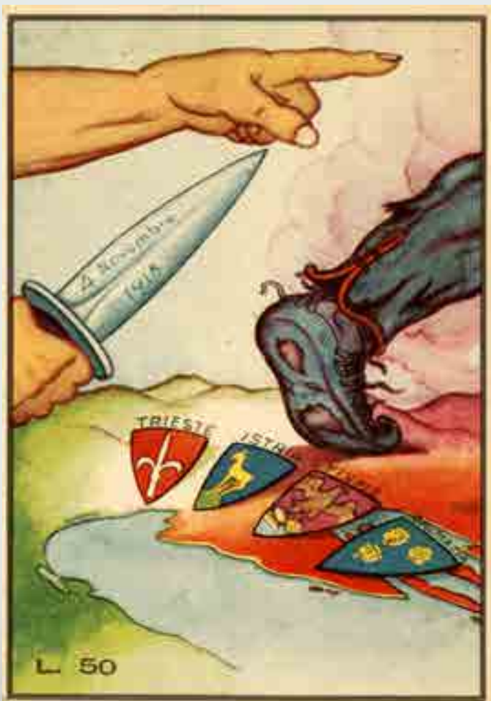
"Va fuori straniero - 4 novembre 1918 - Trieste Istria Fiume Dalmazia", cartolina a cura dell'Associazione Nazionale per la Venezia Giulia e Dalmazia, 1951