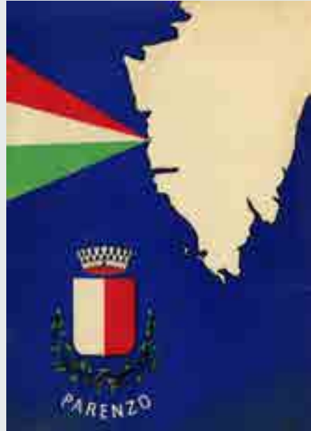
"Addio Parenzo" poesia del Picciola al retro, cartolina, anni '50