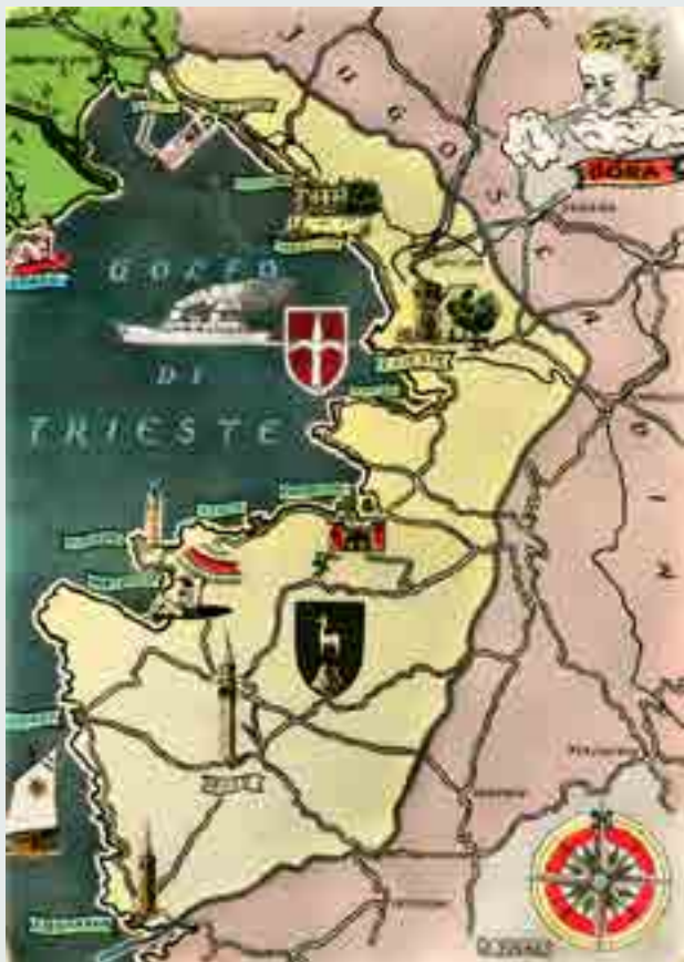
Territorio Libero di Trieste, cartolina, 1948