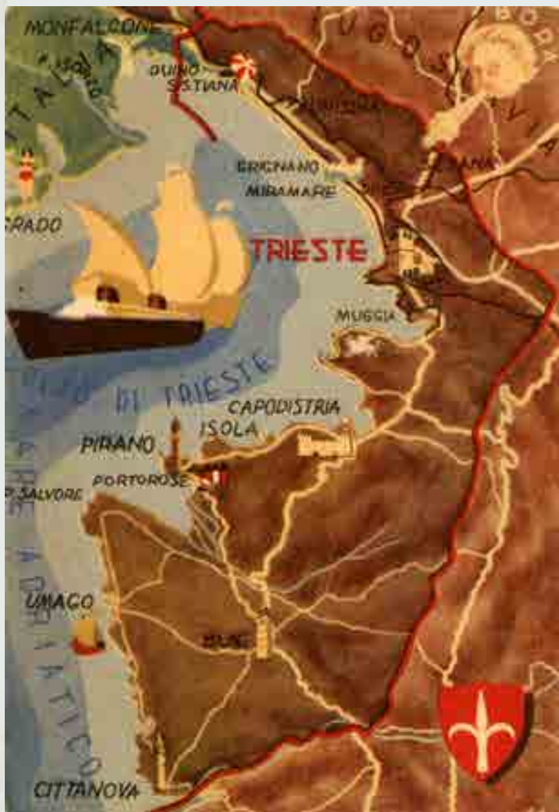
Territorio Libero di Trieste, cartolina, 1947