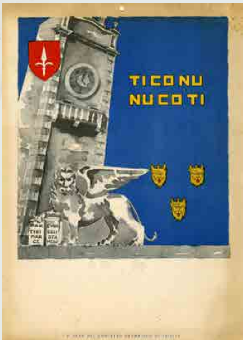
"Ti co nu, nu co ti", a cura del Comitato Dalmatico di Trieste, locandina cartonata supporto per calendario murale, 1948/50

Nel nome della Patria ... Trieste e l'Istria sono indissolubilmente unite!, volantino, 1946/47