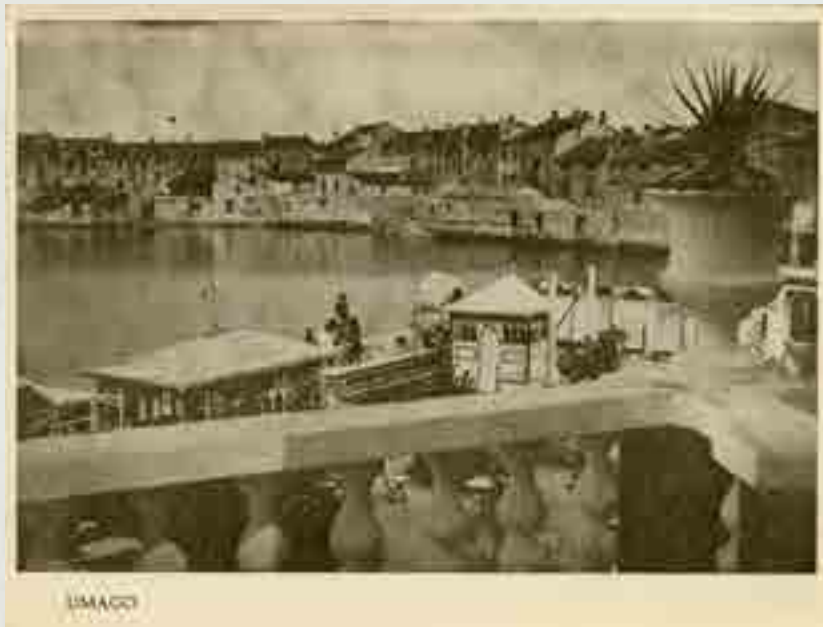
Umago, cartolina ricordo, al retro, (talloncino in alto) Giuliani, Dalmati, "L'Arena di Pola" è il settimanale dell'irredentismo, edita dal Movimento Istriano Revisionista, 1948