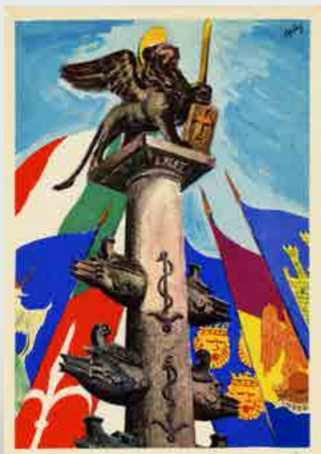
Associazione Nazionale Venezia Giulia e Dalmazia, cartolina, 1965