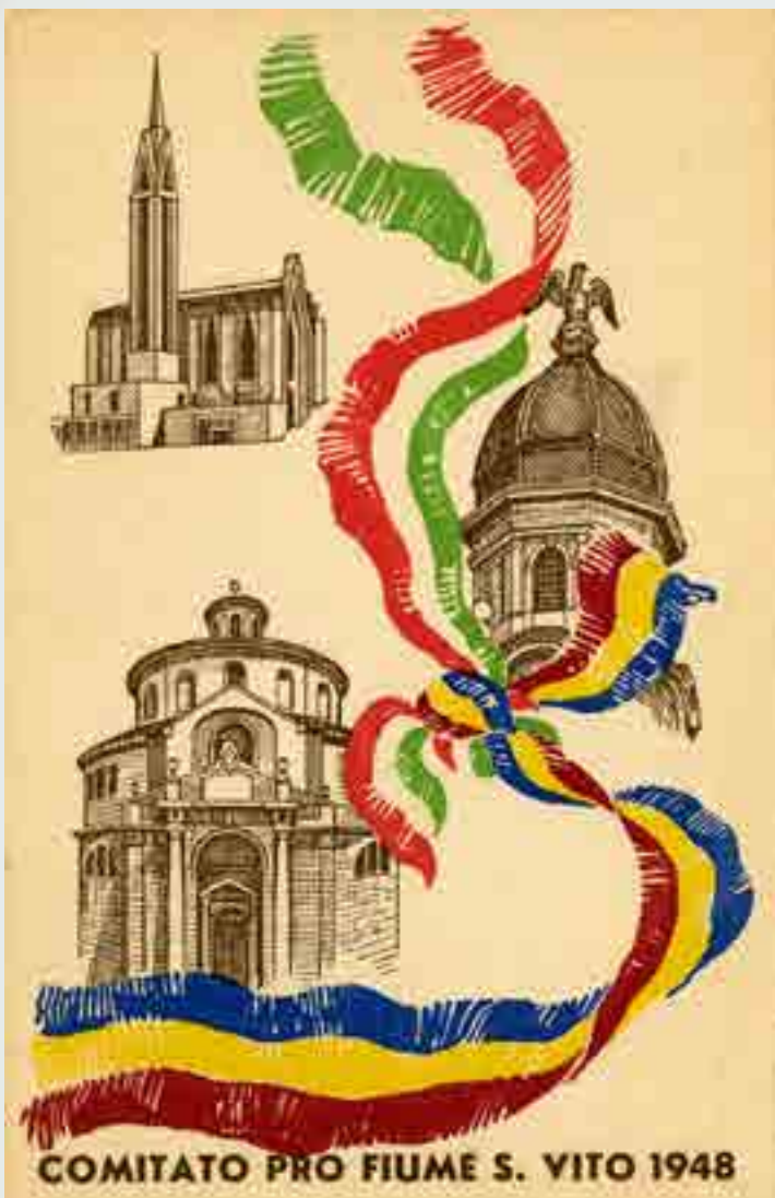
Comitato pro Fiume S.Vito 1948, cartolina a cura del Comitato, 1948