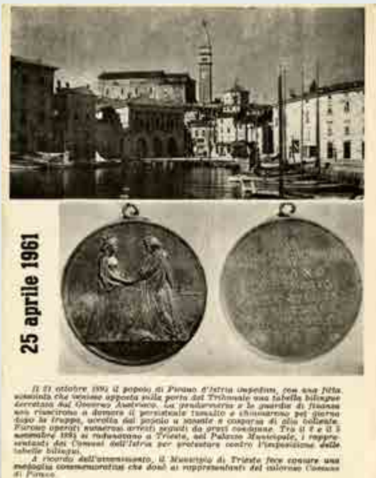
Pirano, 25 aprile 1961, a ricordo della rivolta contro le tabelle bilingui del 1894, cartolina a cura del Comitato Comunale - Consiglio dei Liberi Comuni dell'Istria, cartolina