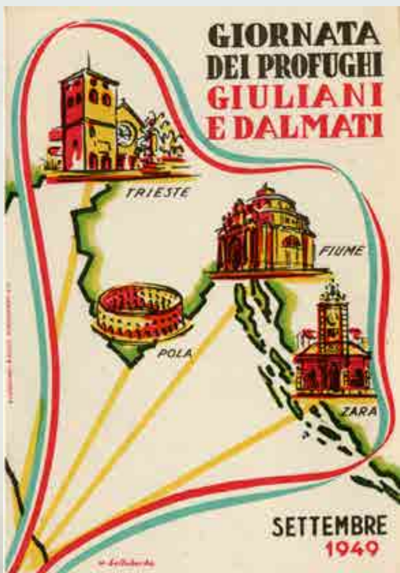
U. DELLABARBA, Giornata dei Profughi Giuliani e Dalmati, settembre 1949, cartolina a cura dell'Associazione Nazionale per la Venezia Giulia e Zara, Comitato Provinciale di Macerata