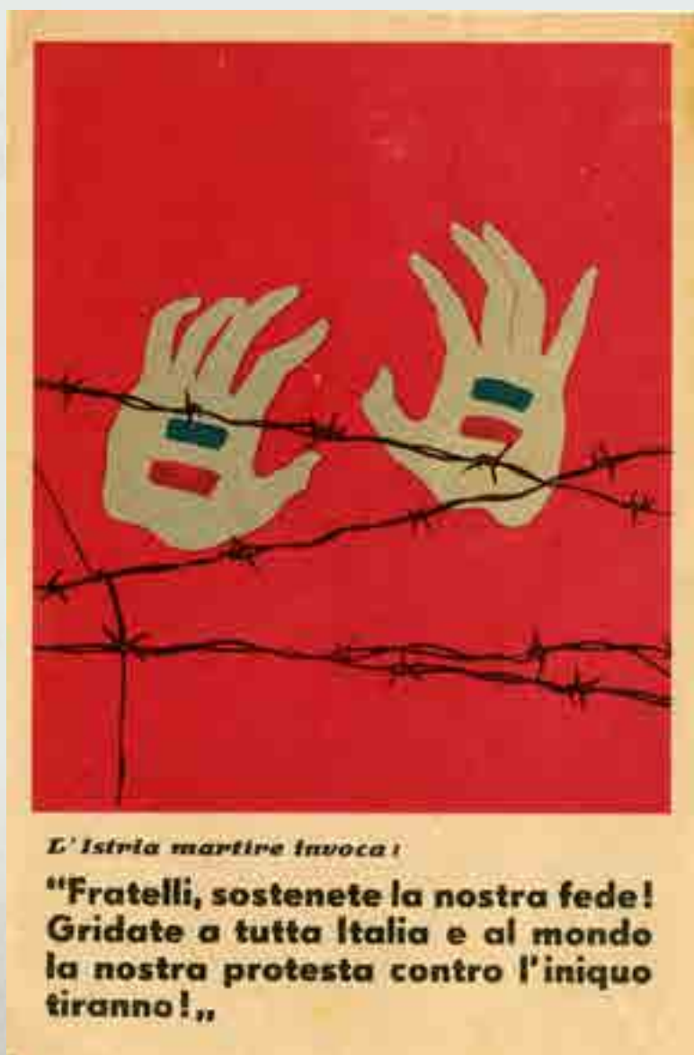
"L'Istria martire invoca ...", volantino 1947/48