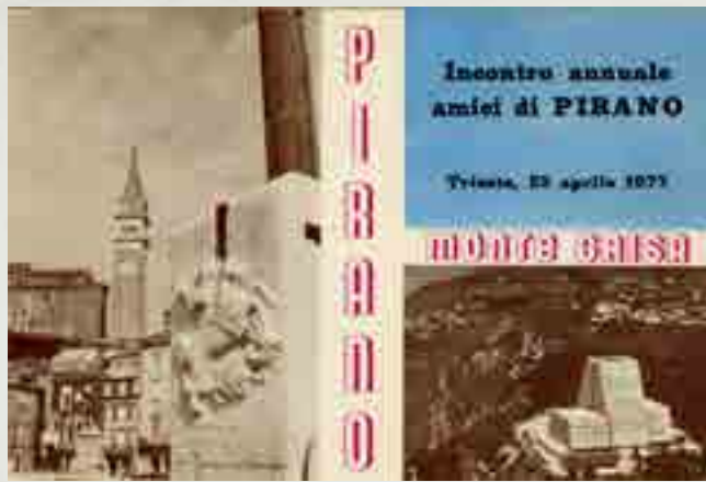
Incontro annuale amici di Pirano a Monte Grisa, Trieste, 25 aprile 1977, cartolina