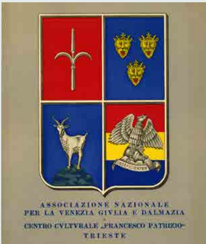
Centro Culturale "Francesco Patrizio" Trieste e Associazione Nazionale per la Venezia Giulia e Dalmazia, locandina cartonata supporto per calendario murale, 1948/50