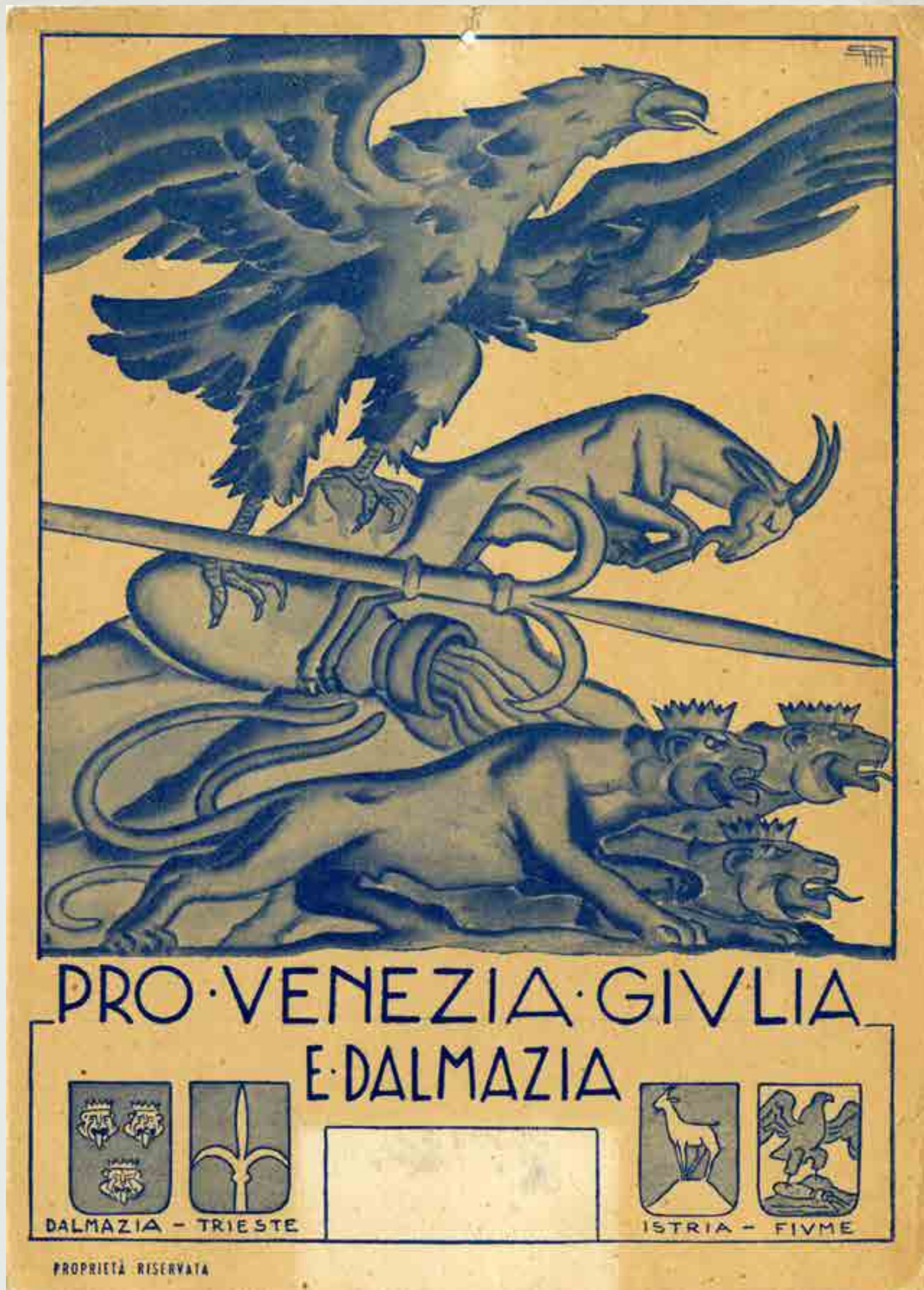
Pro Venezia Giulia e Dalmazia, locandina supporto per calendario murale, 1946/47

Un calendario segna il tempo di un anno, poi esaurisce la sua funzione. Per il 2022 abbiamo voluto oltrepassare la temporalità, lasciando un ricordo che possa rimanere più a lungo nelle vostre raccolte. È il frutto della collaborazione della Famiglia Umaghesa con l'IRCI, l'Istituto Regionale per la Cultura Istriano-Fiumano-Dalmata di Trieste, punta di diamante fra le Istituzioni che operano per conservare la nostra