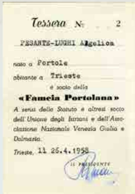
Fameia Portolana, tessera (facciata esterna e interno) di socio che, per Statuto, rende socio anche dell'Unione degli Istriani e dell'Associazione Nazionale per la Venezia Giulia e Dalmazia, rilasciata nel 1958