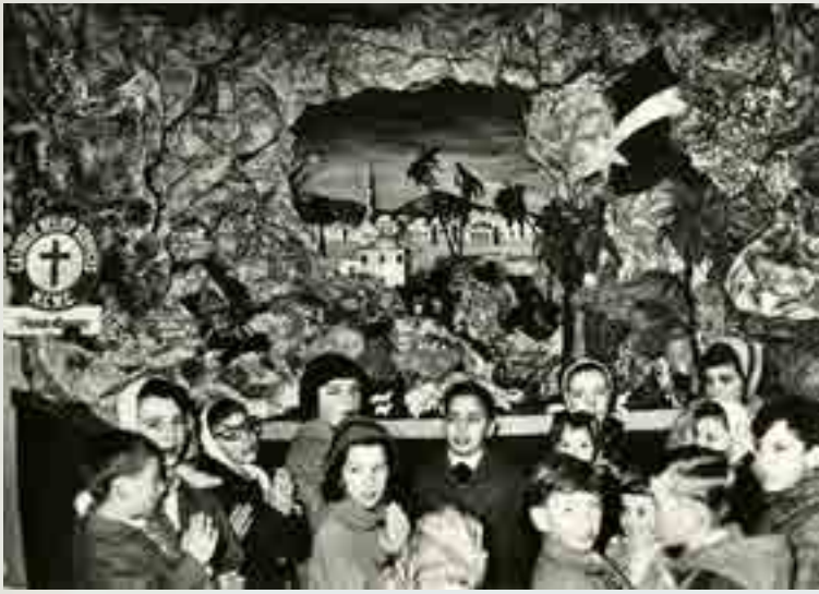
Trieste, Campo Profughi Giuliani delle Noghère, Presepio 1958, cartolina