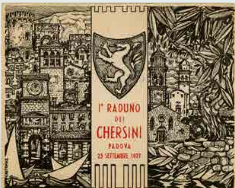
I° Raduno dei Chersini, Padova 25 settembre 1977, cartolina