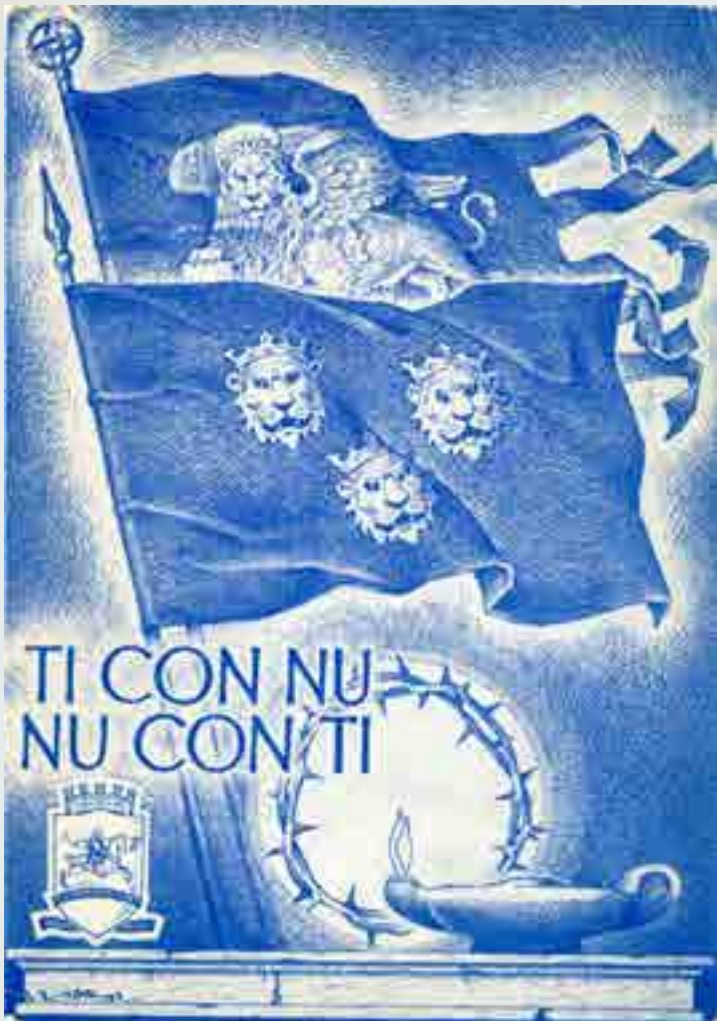
"Ti con nu, nu con ti", XIV° Raduno dei Dalmati, Venezia 30 settembre-1 ottobre 1967, cartolina