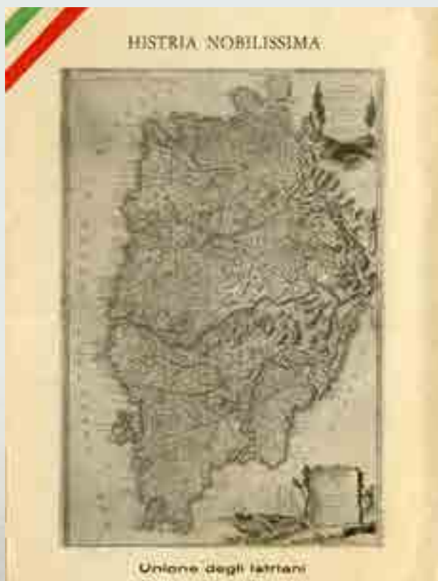
Histria Nobilissima, Unione degli Istriani, cartolina, anni '50