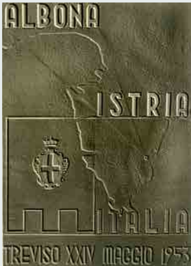
Albona Istria Italia, cartolina per il raduno degli esuli Albonesi, Treviso, XXIV maggio 1953