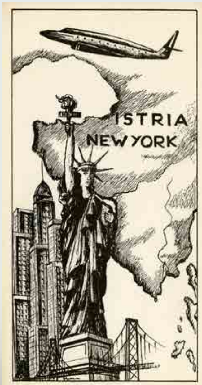
Istria New York - Unione degli Istriani, II.a Crociera della Fraternità, cartolina, 8-13 aprile 1971