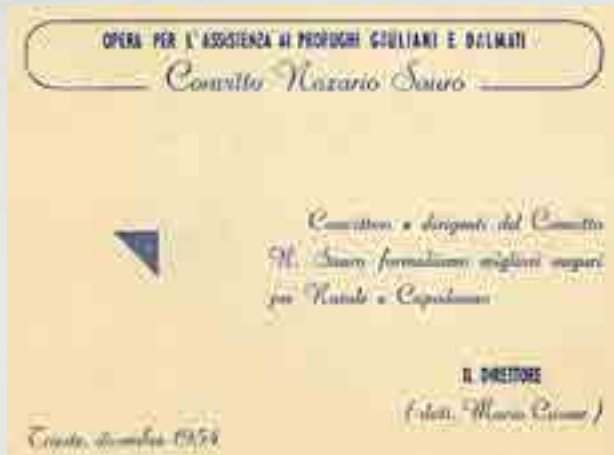
Opera per l'Assistenza ai Profughi Giuliani e Dalmati - Convitto Nazario Sauro, cartoncino di auguri per il Natale del 1954