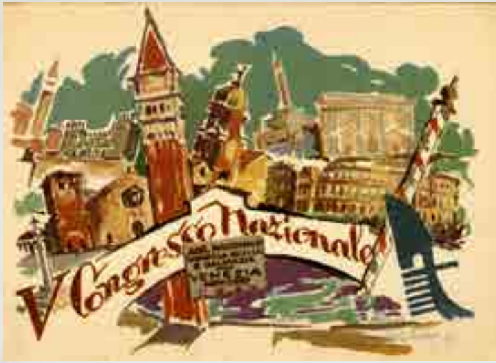
V.° Congresso Nazionale Venezia Giulia e Dalmazia, Venezia, novembre 1957, cartolina