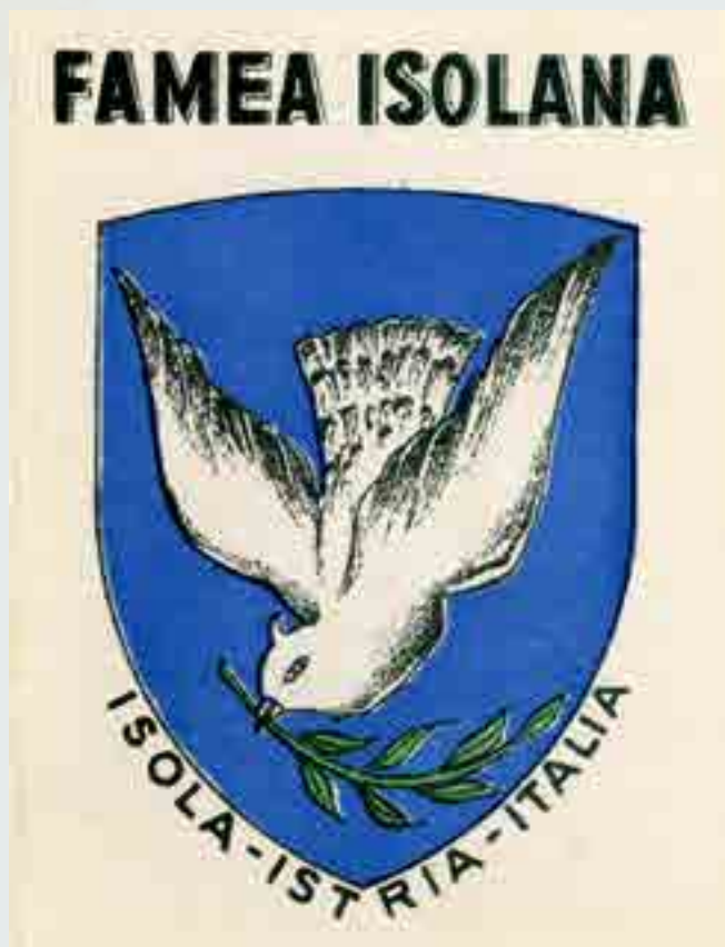
Famea Isolana. Isola - Istria - Italia, tessera di socio ordinario dell'Unione degli Istriani e dell'Associazione Nazionale Venezia Giulia e Dalmazia, anni '50