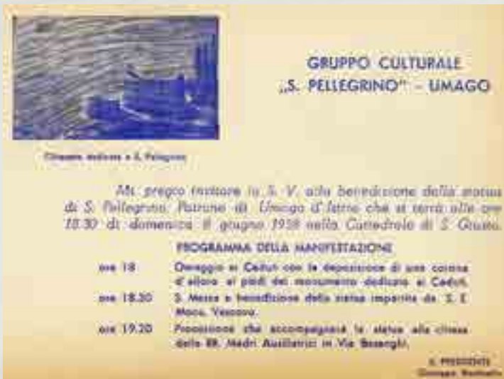
Gruppo Culturale "S.Pellegrino" - Umago, invito per la benedizione della statua del Santo Patrono di Umago, cartoncino, 1958