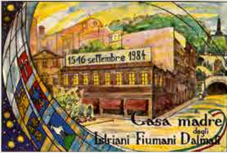
Casa madre degli Istriani Fiumani Dalmati, cartolina per l'inaugurazione 15-16 settembre 1984