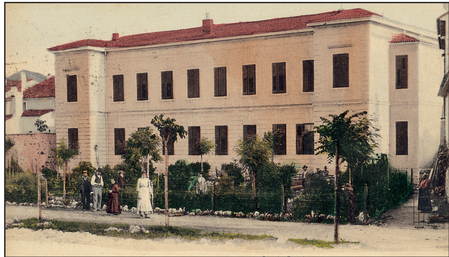
Scuola de Umago

Sepa: seppia. Dal latino volgare sepja dal greco sepia .