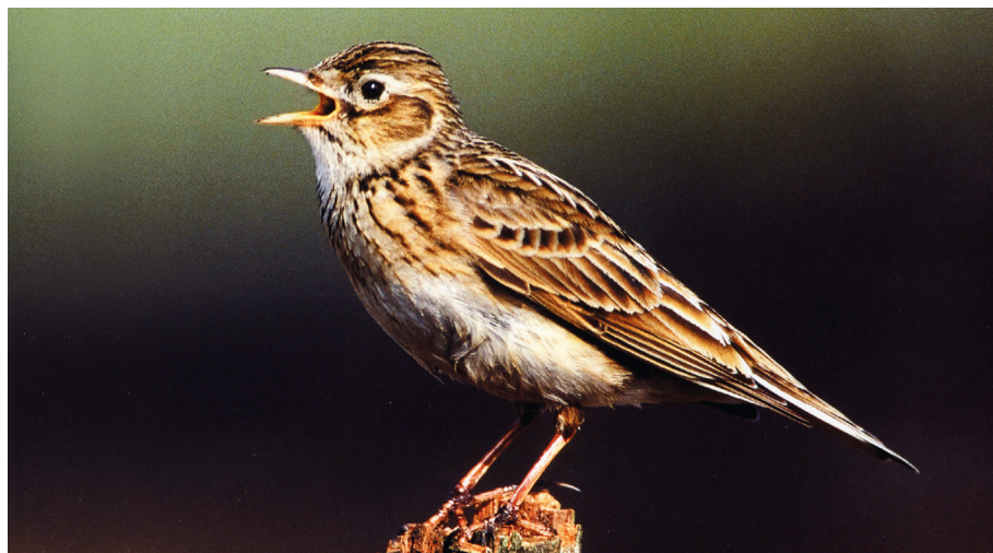
Pagnaròl / Pagnaròi

Persèmololo: prezzemolo. Dal greco petroselinon (sedano delle rocce). –LA SE COME EL PERSÈMOLO (LA SE INTRUFOLA PAR DUTO, LA SE INTRIGA DEI AFÀRI DE DUTI)–