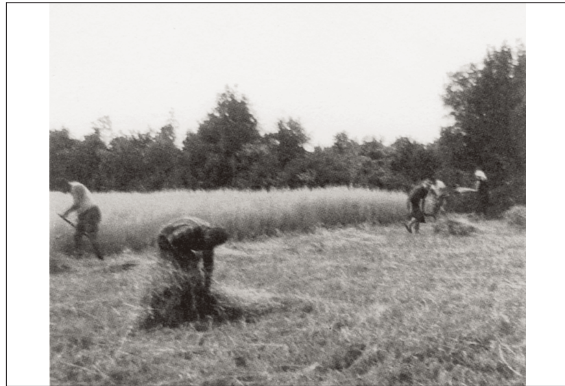
Sešolàr umago 13 gem 1975 pag 23.

Sopa, Zopa* : zolla di terra, zolla erbosa. Dal franco tupfa (ciuffo) dal longobardo zupfa (ciuffo di capelli).